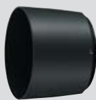
Bajonet senilo HB-71 (u kompletu)