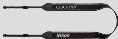
Kaiš fotoaparata AN-CP21