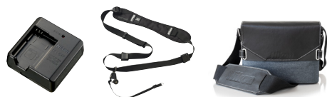
Punjač baterije MH-67P Blackrapid Quick-Draw treger S AN-SBR3 Torbica od prave kože CS-P12

*2 Pojedinačne datoteke filma ne smeju da budu veće od 4 GB ni da traju duže od 29 minuta. Ako temperatura fotoaparata poraste, snimanje može da se prekine i pre nego što se dostigne ovo ograničenje.